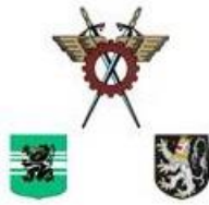
Kring Mars & Mercurius Gent O-VI v.z.w.