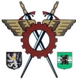
Kring Mars & Mercurius Gent O-VI vzw