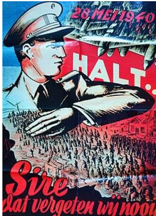
De Koning beschermt zijn volk